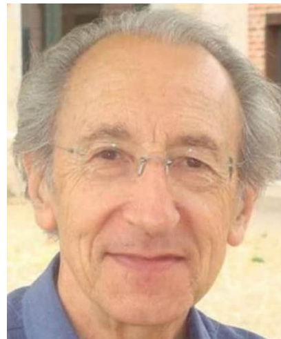
Philippe Daverat Compagnie Vincent Philippe