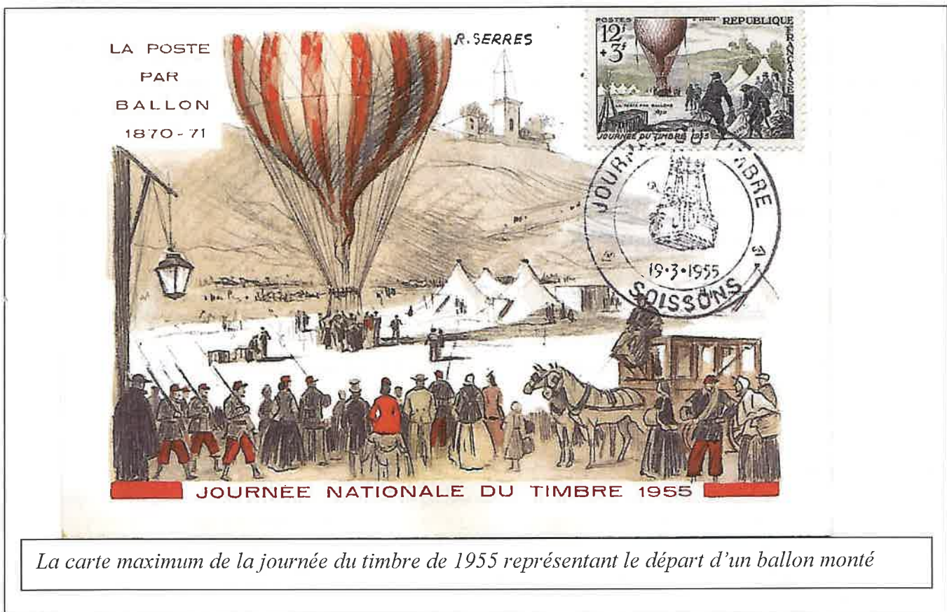
La carte maximum de la journée du timbre de 1955 représentant le départ d'un ballon monté