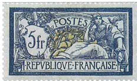
n° 123 / neuf : 360 € / obl. 6€