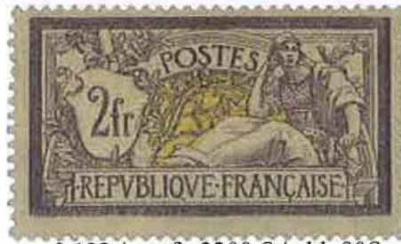
n° 122 / neuf : 3200 € / obl. 90€