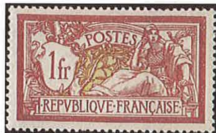
Bien centré (rare)