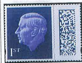
D'après maquette, couleurs et visuel non-contractuels.