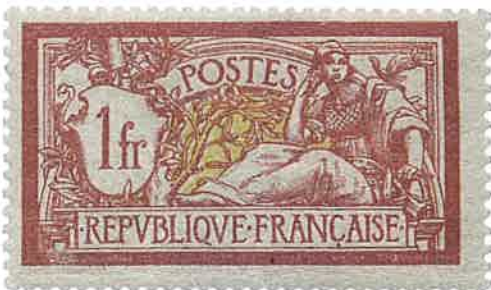
Centrage médiocre (courant)

On aurait tant voulu faire sortir ce timbre à l'occasion de la grand Exposition Universelle de 1900 au sein de laquelle se déroulait l'Exposition Internationale de Philatélie à Paris, mais vu le retard pris, les timbres Merson furent mis en vente le 4 décembre 1900 en avant-première, aux bureaux de poste de la chambre des députés et du Sénat.