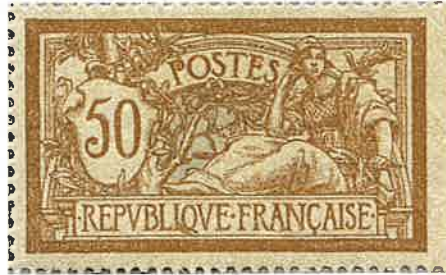
n° 120 / neuf : 580 € / obl. 2€