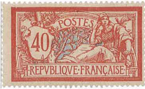
n° 119 / neuf : 65 € / obl. 1€

Voici les 5 premiers timbres Merson avec leur cote Yvert 2023