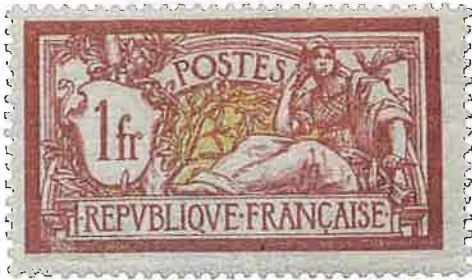
n° 121 / neuf : 115 € / obl. 1€